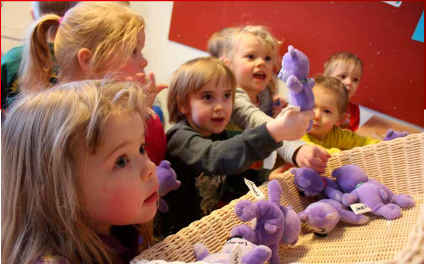
Börn á leikskólanum Uglukletti þar sem unnið er með Vináttu.