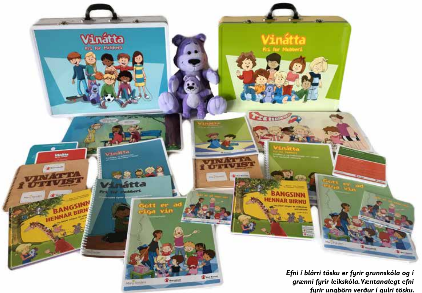
Efni í blárri tösku er fyrir grunnskóla og í grænni fyrir leikskóla. Væntanalegt efni fyrir ungbörn verður í gulri tösku.

að börnin í hópnum þar sem unnið var með efnið tjáðu í auknum mæli tilfinningar sínar, voru mun jákvæðari í samskiptum sínum við önnur börn og sýndu meiri samkennd samanborið við börnin í viðmiðunarhópnum. Áhrifin eru tölfraðilega marktæk.