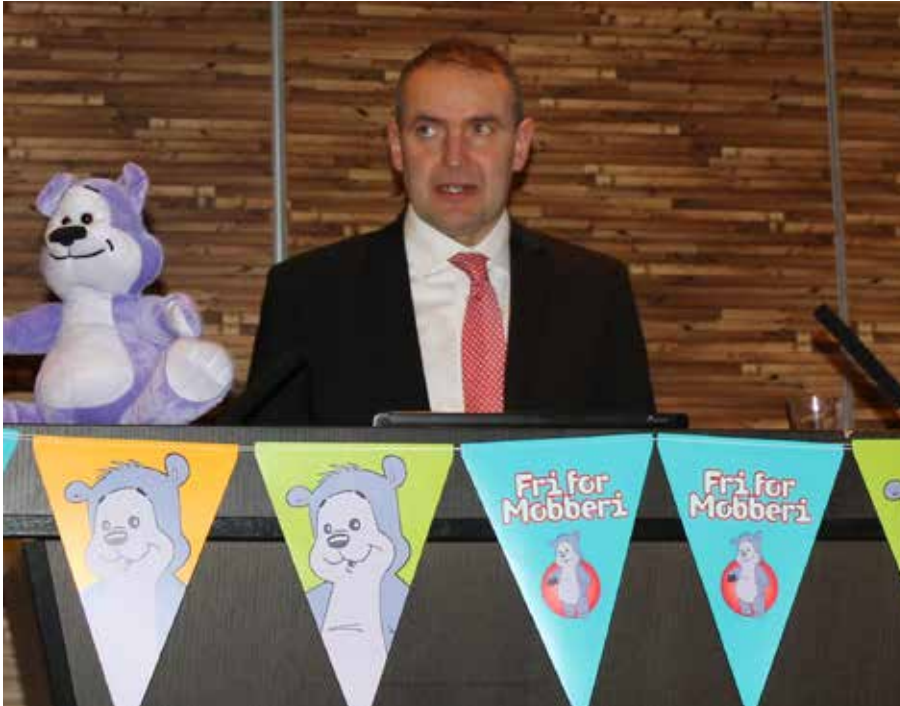
Guðni Th. Jóhannesson, forseti Íslands, flutti ávarp á námstefnu um Vináttu.