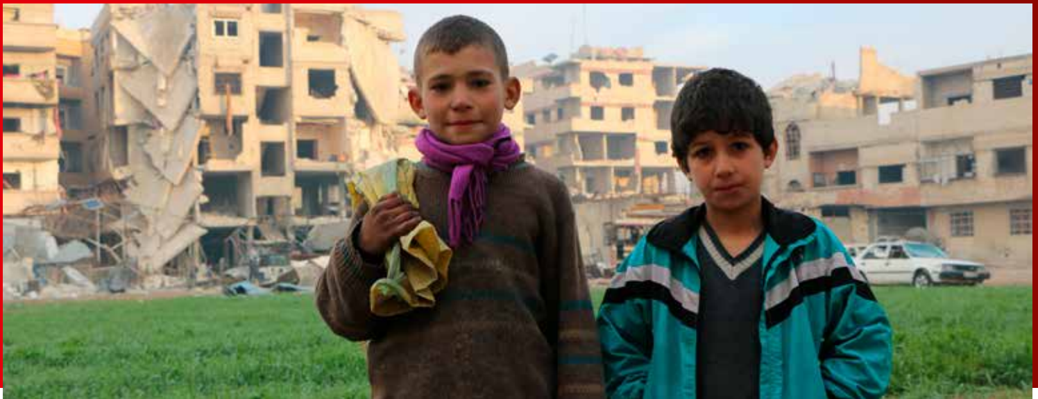
Tveir drengir í Austur-Ghouta í Sýrlandi sem orðið hefur hart úti í stríðinu. Myndin er tekin í febrúar 2018.