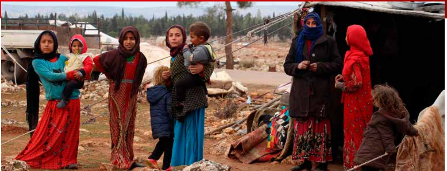
Börn í tjaldbúðum í Idlib-héraði í Sýrlandi. Myndin er tekin í janúar 2018.