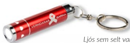
Ljós sem selt var í landssöfnun Barnaheilla 2022

Haustsöfnun Barnaheilla 2022 er árlegt fjáröflunaráttak til styrktar þróunarverkefni Barnaheilla í Síerra Leóne. Söfnunin var haldin í annað sinn og stöð yfir í 10 daga frá 25. ágúst til 5. september. Söfnunin gekk vonum frammar, þar sem tæplega 10.000 armbönd voru seld víða um land og í vefverslun Barnaheilla.