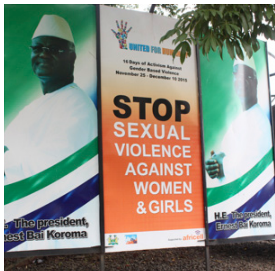
Götuskilti sem sýnir herferð í Sierra Leone gegn ofbeldi á stúlkum og konum.