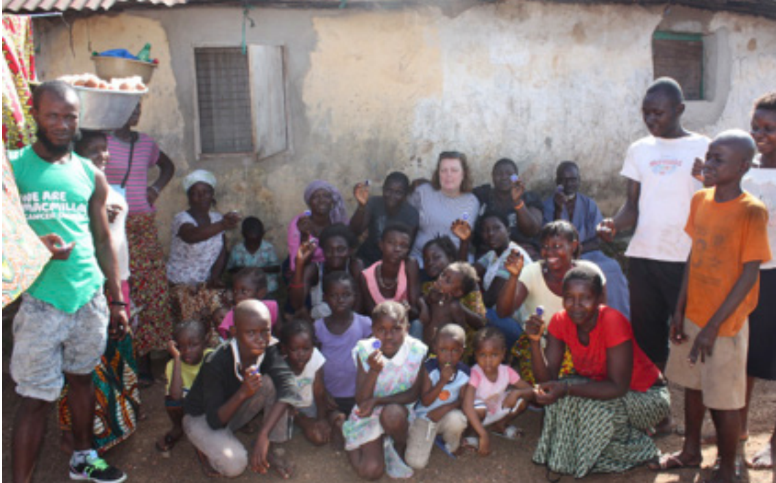
Ljós gefin í hverfi í Goderich, börnin í þessu þorpi ganga yfirleitt ekki í skóla.