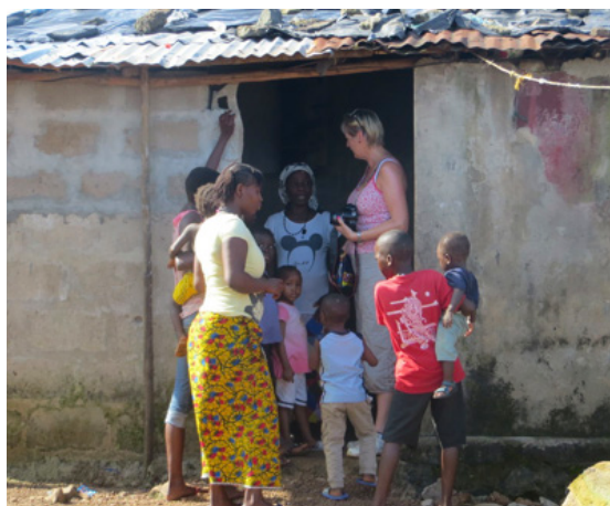
Saumakona sem vinnur heima. Hún er ekki með neitt rafmagn, allt fót- og handstigið. Hún þáði ljós með þökkum. Ljósið gefur henni nokkrar mínútur aukalega dag hvern, til að klára verkin eftir að myrkrið er skolið á t.d. að ganga frá.