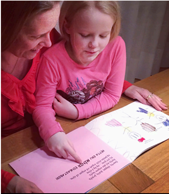
Móðir les með barni sínu bókina Einkastaðir líkamans .

við þau um líkamann, einkastaðina og mörk og hvað ætti að gera ef einhver færir yfir þau mörk hefði það hugsanlega hjálpað þeim að opna sig fyrir um ofbeldi sem þau urðu fyrir.