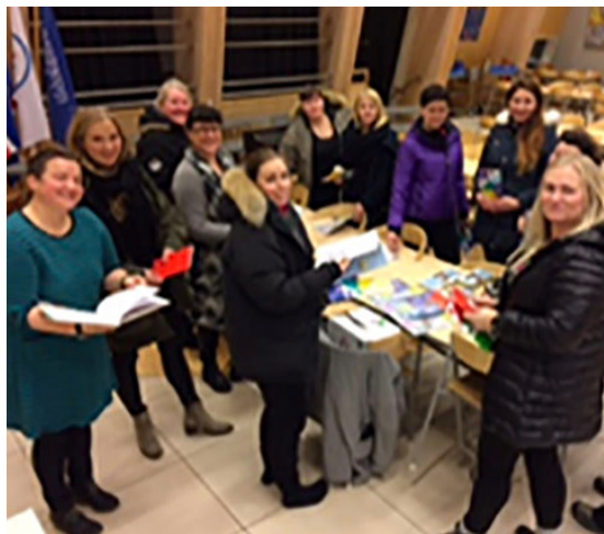
Foreldrafélög leikskólans og Grunnskólans á Hvolsvelli fengu fyrirlestur og bókagjöf frá Blátt áfram.