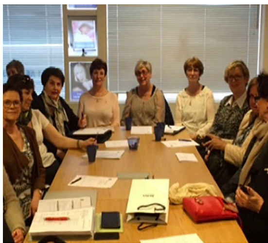
Soroptimistaklúbbur Árbæjar fékk fyrirlestur um starfsemi Blátt áfram. Í kjölfarið tóku þær þátt í ljósasölu samtakanna og létu andvirði sölulaunanna renna óskipt til Blátt áfram.