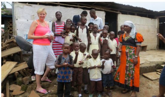
Ljós gefin í skóla þar sem kennarar fá ekki föst laun, en þiggja allar gjafir.

Samtökin Child Welfare Society - Sierra Leone , eru grasrótarsamtök sem vinna að margvíslegum forvörnum fyrir börn í Sierra Leone. Samtökin höfðu samband við Blátt áfram síðla árs 2014 og voru áhugasöm um að heyra hvernig við hjá Blátt áfram störfum. Í fyrstu höfðum við eingöngu aðstöðu til að vera í samskiptum í gegnum tölvupósta, en haustið 2016 var starfskonu Blátt áfram boðið til Sierra Leone og var eitt af verkefnum þeirrar ferðar að hitta starfsfólk hjá CWS, skiptast á skoðunum og upplýsingum og hvernig við getum hjálpað hvort öðru. Vandamálin eru oft þau sömu, hvar sem þú ert staddur í heiminum. Auk þessa heimsótti starfskona Blátt áfram munaðarleysingjaheimili, skóla og fátækrahverfi og gaf fullorðnum, jafnt sem ungu fólki ljós frá Blátt áfram. From darkness to light , var kjörorð þeirra heimsóknna, en mörg hverfi og þorp í Sierra Leone eru án rafmagns.